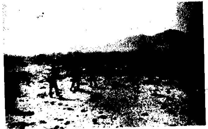
ከአሲምባ ቃሊም የሰራዊቱ ጉዞ

ሀይቅ መስሐል ሰንደርስ አራቱ ጋንታዎች ወደ አጉላላ ሲሄዱ፣ እኔ የነበርኩባት ጋንታ ሀይቅመሳል እንድትቀር ተደረገች። የቀረነው አንድ ሕዝቡን ያስቸገረ ሽፍታ መኖሩን በመስማታችን አሉን ለመያዝ ነበረ። ሽፍታውን በቁጥጥር ስር አድርገን ለሦስት ቀናት የፖለቲካ ትምህርት እንዲሰጠው ተደረገና ትጥቁን አስፈትተን ለቀቅነው። አራቱ ጋንታዎች ያሉበት ቦታ ሰንደርስ የአጉላላን ከተማ ተቆጣጥረውና የሄዱበትን ተልእኮ አሳከተው ጠበቁን።